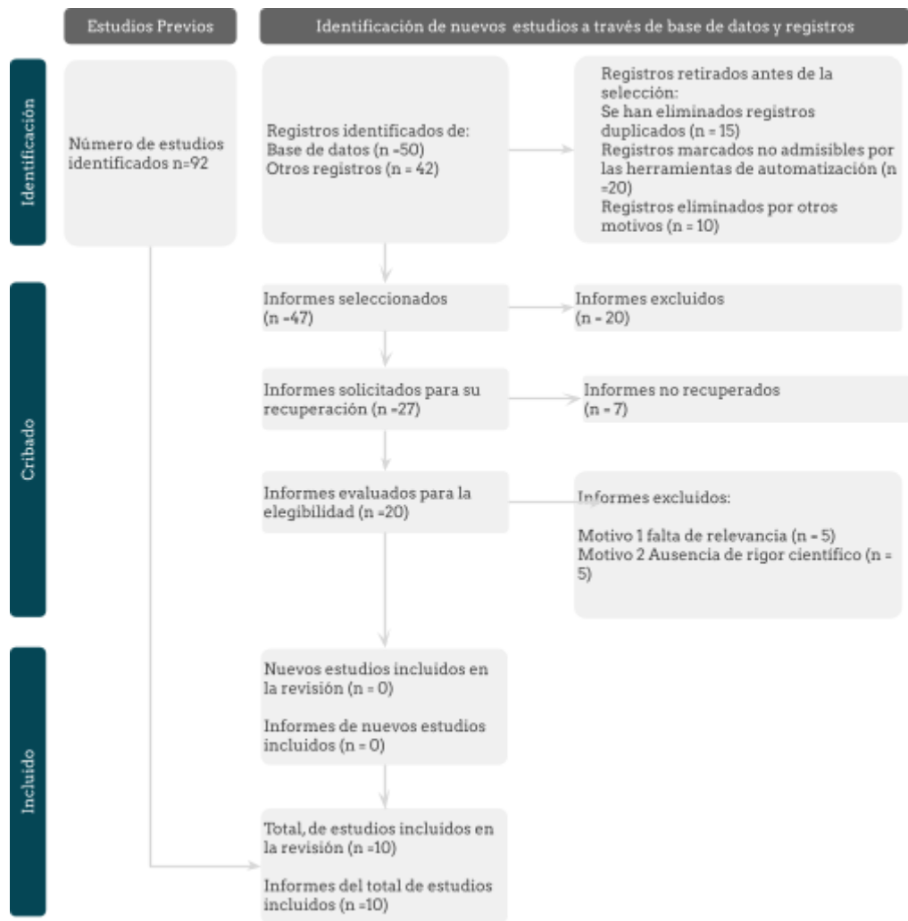
Diagrama de flujo PRISMA

En el Gráfico 1 se describe el proceso de selección de artículos realizado en tres fases. En la primera fase, se realizó una búsqueda exhaustiva en las bases de datos para identificar un conjunto inicial de registros. En la segunda fase, dos investigadores revisaron de forma independiente los títulos y resúmenes de los registros recuperados para identificar aquellos que cumplieran con los criterios de elegibilidad. Se resolvió cualquier desacuerdo mediante discusión y consenso. En la tercera fase, se realizó una lectura completa de los artículos preseleccionados para la inclusión final. Los diez artículos proporcionados en las tablas del documento adjunto se incluyeron de manera obligatoria como el corpus central de esta revisión.